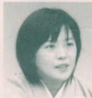
きょくどう こぶみ 旭堂小二三氏 (講談師)

1995年より俳優・舞台活動開始。2001年7月旭堂小南陵(現四代目旭堂南陵)に入門。講談師に。新作歴史講談として「篤姫」「桂昌院」「浅井家の女たち」「新撰組局中法度」「芹沢鴨」「アカデミー賞講談」ほか多数。ご当地講談や偉人伝、体験記講談など歴史物語以外の講談でも精力的に活動を続け、現在、古典・新作講談はもちろん、各種メディア・講演・司会・舞台・大道芸など、各地で活躍中。